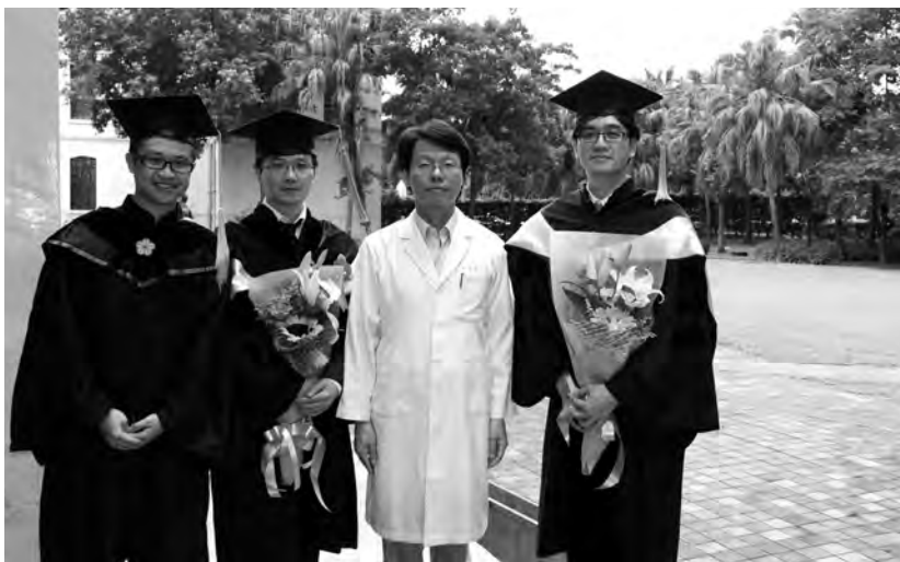
■2013年黃敏銓的第一批醫學士 - 博士生畢業。