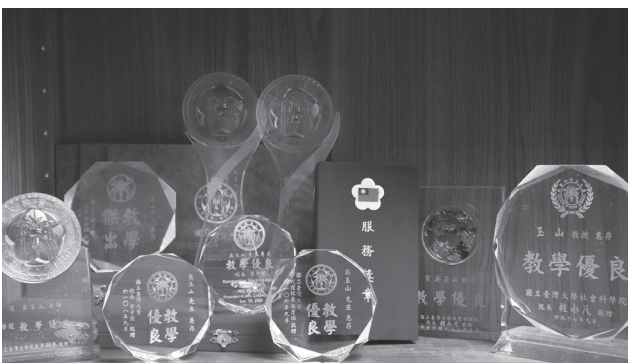
■ 吳玉山的教學深獲學生肯定，多年來獲獎無數。