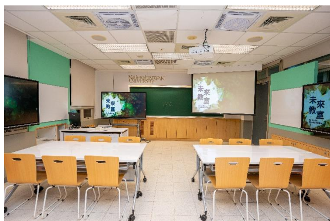
教室前方螢幕與黑板