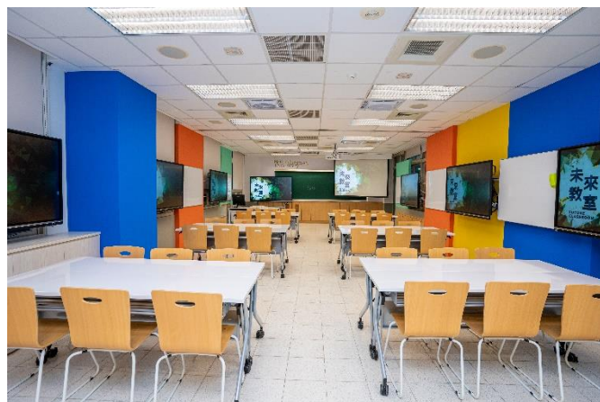
正對教室前方視角