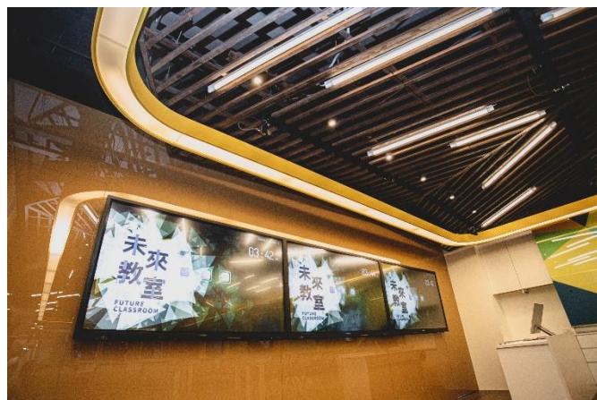
教室前方三面螢幕