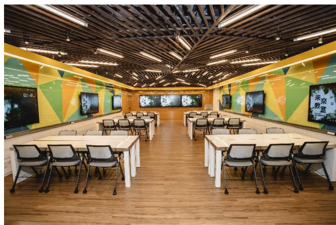
正對教室前方視角