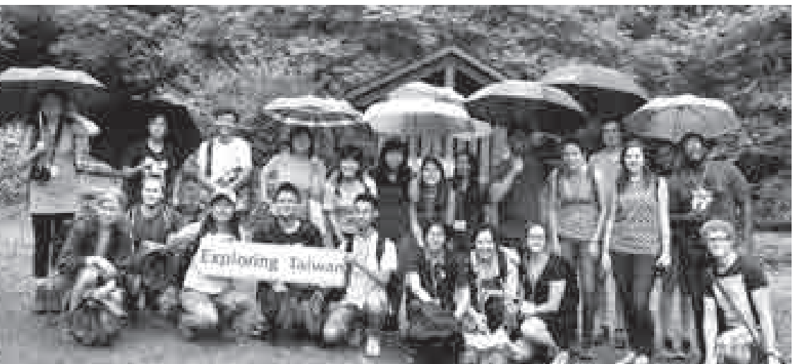
■ 課程中不乏讓學生親近山林的機會。

袁孝維說，最初開這門課是為了提供國際生更多元的選課資源，因此參考理學院姜蘭虹教授類似課程後，重新擬訂授課大綱，並串連生農學院及理學院老師共同開課。